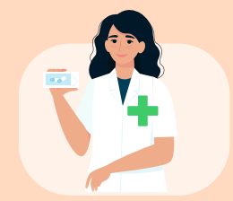
Pharmaciens Officine et Pharmacie à Usage Intérieur